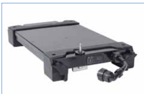
Capacidade de uma ou duas horas da bateria/no-break