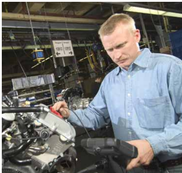
Inspeção do encaixe da válvula através da porta da vela de ignição

Os laboratórios de P&D podem aproveitar as imagens aprimoradas da ferramenta e a alta iluminação de saída para gerar imagens visuais claras do ajuste dos componentes em novos projetos automotivos. Com lentes aperfeiçoadas, processamento de sinal digital e uma tela LCD VGA com extra brilho e alta resolução, o sistema Everest XLG3 fornece imagens de inspeção brilhantes e distintas para agilizar a identificação de defeitos. E nos locais de inspeção onde há falta de energia, o sistema funciona durante até duas horas com um conjunto de bateria e no-break integrado.