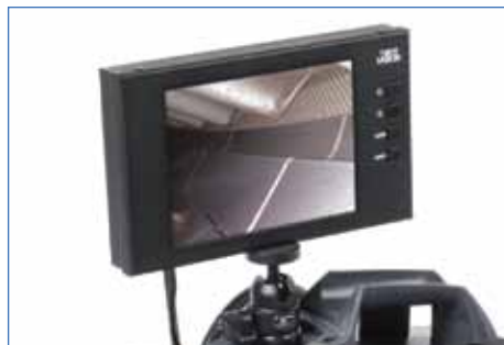
Monitor LCD SVGA externo