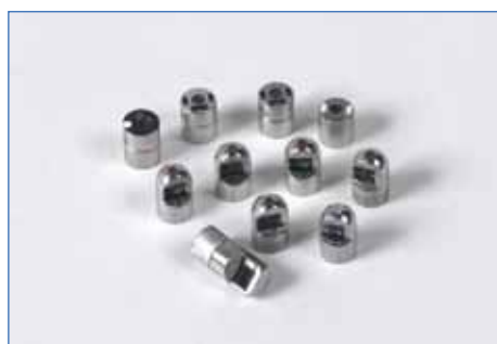
Série completa de ponteiros ópticos incluindo medição estéreo e de sombra com um bloco de verificação rastreável ao NIST