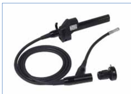
Adaptador de boroscópio para boroscópios rígidos e flexíveis e lentes de alta ampliação