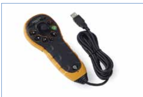
Controle remoto com fio com joystick