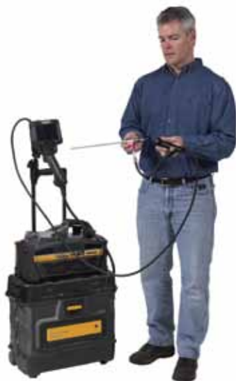
Adaptador para boroscópio a fim de integrar o boroscópio atual rígido e flexível do usuário.

A medição 3D aumenta a eficiência em aplicações aeroespaciais e equipamentos rotativos. Esta tecnologia 3D fornece uma varredura tridimensional precisa da superfície, permitindo medidas em diferentes aspectos das indicações na superfície. Usando uma única ponteira óptica, inspetores podem tanto visualizar como medir um defeito, economizando tempo e aumentando a produtividade da inspeção. Esta tecnologia elimina passos adicionais necessários para retirar a sonda, substituir a ponteira óptica e localizar novamente o defeito. A medição 3D fornece medição precisa sob demanda, enquanto simplifica o processo de inspeção.