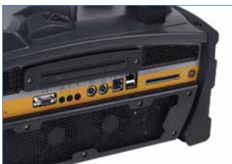
Dois slots para placa de PC para cartões de memória expansíveis