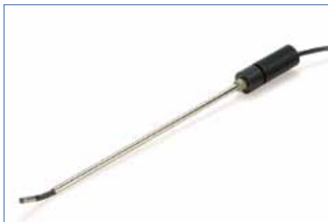
Tubo rígido e direcionadores