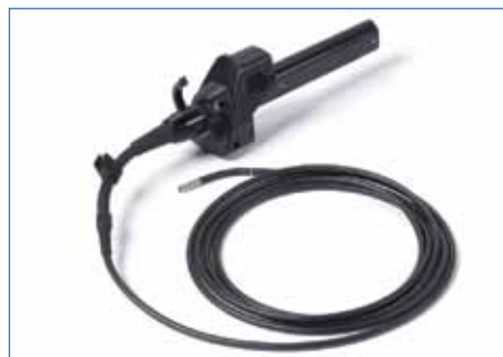
Sondas de reposição QuickChange™ com diâmetros de 3,9 mm, 5,0 mm, 6,1 mm, 6,2 mm com canal de trabalho e de 8,4 mm com comprimentos de 2, 3, 4,5, 6, 8, e 9,6 metros