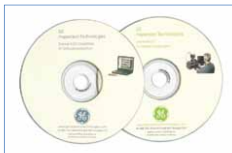
Software aplicativo (inspeções direcionadas por menu e geradores de relatórios)