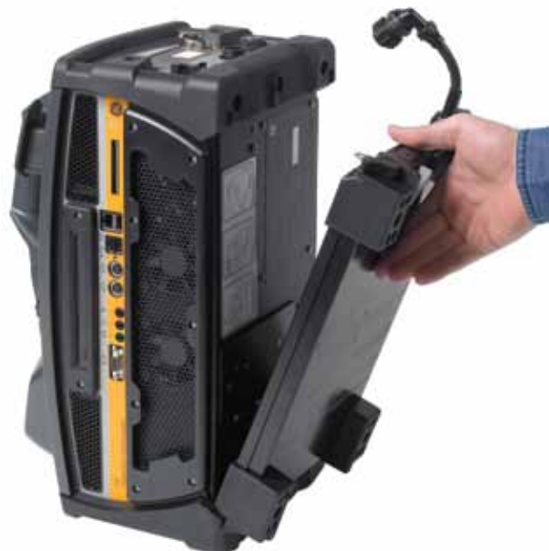
Sistema com bateria integrada