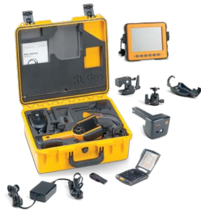
Case de armazenamento padrão e acessórios da XL Go+