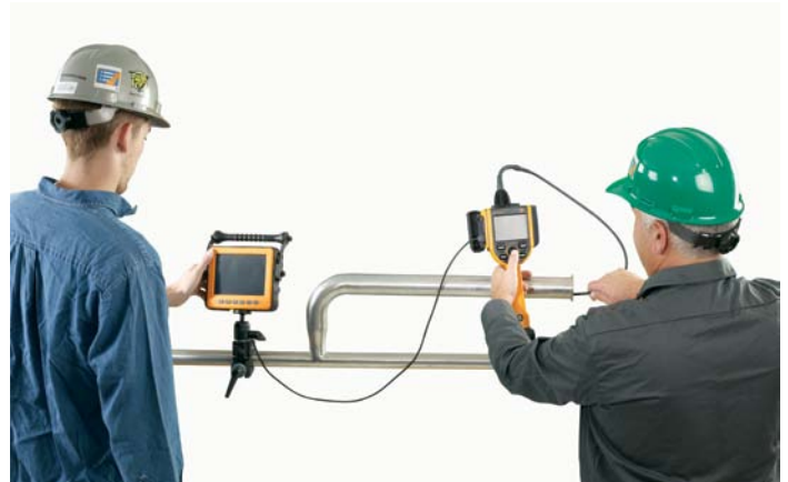
XL Go+ con monitor externo XpertVision

Las pantallas LCD de los sistemas XL Go+ y XpertVision han sido diseñadas para ser completamente legibles en instalaciones o espacios exteriores con una iluminación demasiado potente o nada propicia o en entornos nevados. XpertBright proporciona una visualización óptima con la mejor calidad de imagen.