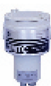
Transmissor de gás de condutividade térmica XMTC