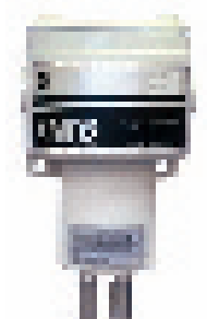
Transmissor de oxigênio termoparamagnético XMO2

O TMO2D é um módulo de controle e visor opcional que aprimora o desempenho e a operação de transmissores, tais como XMO2, XMTC ou O2X1. Ele fornece um visor LCD de duas linhas e 24 caracteres com luz de fundo, visor e opção de programação através do teclado, saídas de gravador, relés de alarme e relés para orientar os solenóides do sistema de amostra na calibração automática de zero e amplitude, bem como uma fonte de alimentação de 24 V CC para o transmissor. O TMO2D também fornece compensação do sinal de oxigênio com base em microprocessador para se obter uma precisão aprimorada para o transmissor TMO2.