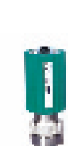
Transmissor galvânico de oxigênio para célula de combustível O2X1