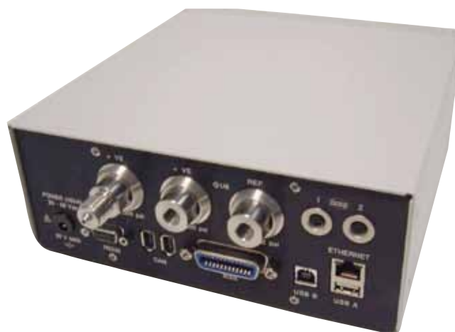
PACE1000 dal retro