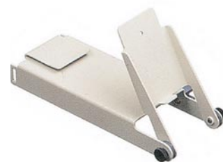
本体スタンド MIC 1040