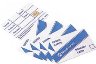
メモ리카ード (測定・校正データの保存) MIC 1000 (1枚) MIC 1001 (5枚)