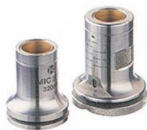
手動プローブ用ユニバーサルガイド MIC 270 手動プローブ用ユニバーサルガイド MIC 271