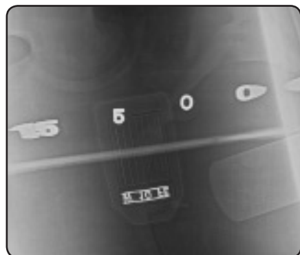
炭素鋼配管の溶接部