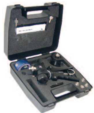
Pneumatisches und hydraulisches Testkit