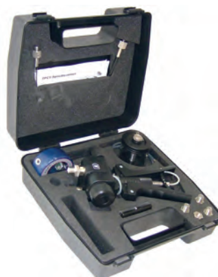
Kit di test idraulico