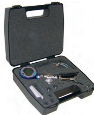
Kit di test pneumatico