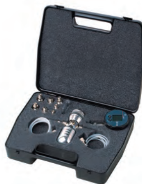
Kit di test pneumatico bassa

Include: DPI 104; campi fino a 10.000 psi (700 bar), pompa di test combinata idraulica e pneumatica PV 411A, serbatoio idraulico, tubazione flessibile, adattatori, O-ring e valigetta in ABS.