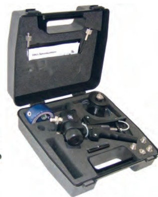
Kit di test pneumatico e idraulico