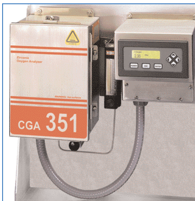
Versão padrão do CGA 351