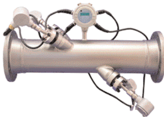
Um sistema de medição PanaFlow bidirecional

O sistema BWT faz parte do nosso sistema de medição PanaFlow. Nosso sistema PanaFlow para líquido usa exclusivamente os transdutores BWT devido a seus recursos de desempenho avançados. O nosso PanaFlow para gases adota a tecnologia BWT em serviços de temperaturas extremas para estender a capacidade de aplicação do PanaFlow.