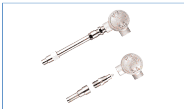
Gruppo di tamponi lunghi FWPA (in alto) e gruppo a tamponi corti FWPA (in basso)

Temperatura del fluido: da -40°C a 100°C