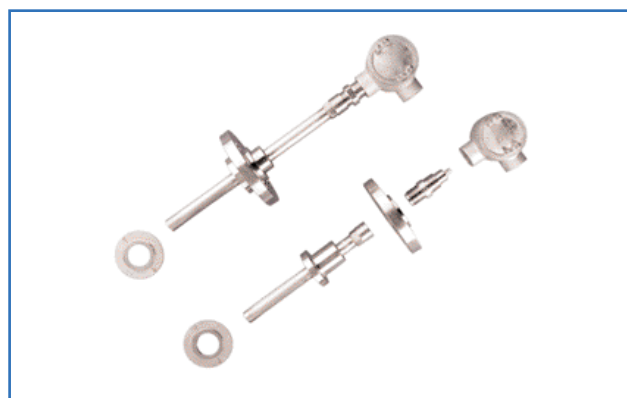
Sistema a tamponi lunghi FTPA (in alto) e sistema a tamponi corti FTPA (in basso)

Fino alla massima pressione di esercizio consentita dalla flangia a temperatura o 240 bar