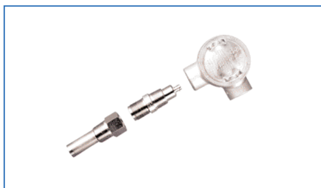
Sistema a tamponi corti FSPA

Temperatura del fluido: da -40°C a 315°C